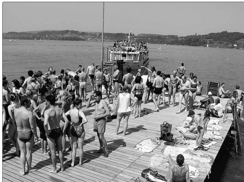
Das Schiff verlässt die Badi in Richtung Insel Lützelau.

Die langjährige Zusammenarbeit mit den Sponsoren Wasserversorgung der Stadt Rapperswil und dem Hensa-Schiffahrtsbetrieb garantiert